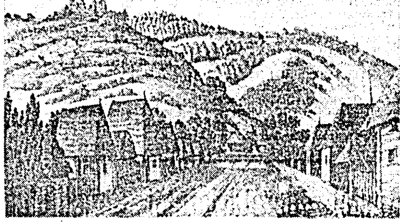
Dezna de altădată

Unii ar putea crede că schimbarea model este determinată de întâmplare. Există o serie de anecdote care ar putea confirma această teză. Printre ele se enumeră aceea cu privire la cîinele care a rupt pantalonul regelui și astfel s-a introdus moda pantalonului zdrențuit, sau aceea privitoare la regele care și-a stropit din greșeală pantalonul cu noroi. A suferit puțin pantalonul, pentru că pețele să nu se observe și drept urmare, bărbaii au purtat timp îndelungat... pantalonii cu manșete.