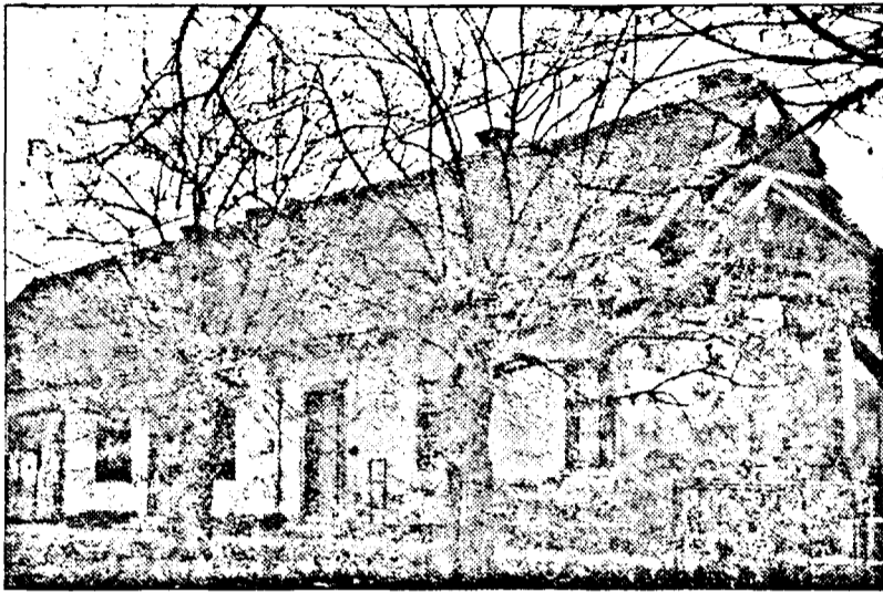
Clădirea fostei primării din Sânicolau.

Deși cartier al Aradului, Sânicolau Mic seamănă mai degrabă cu o comună oarecare, situată undeva, la marginea județului. Pe locuitorii de aici însă, cel mai tare îi macină sentimentul că au fost abandonați de autorități. Cu atât mai mult, cu cât populația din Sânicolau Mic este una bună plătitoare de impozite și taxe locale.