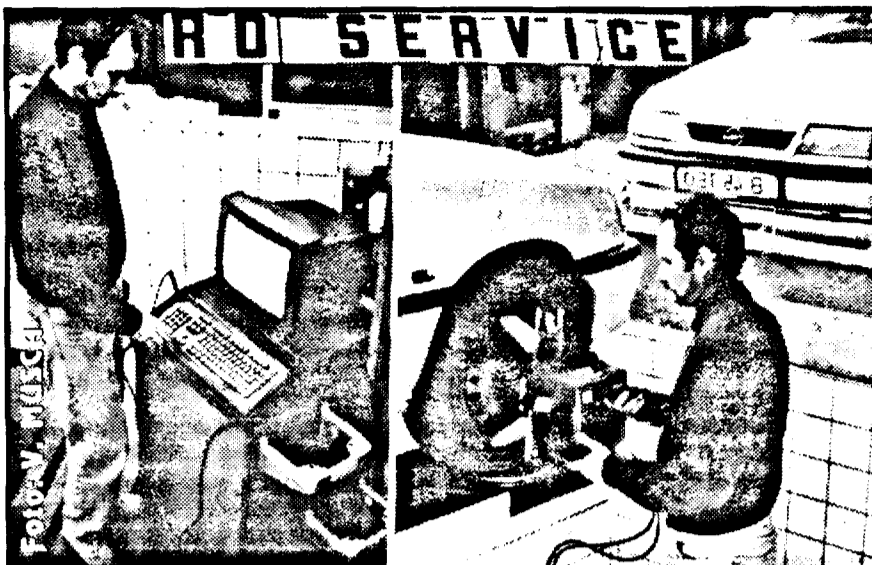
Unul din punctele forte ale RO-SERVICE-ului din Micălaca (de la piciorul podului) este reglarea computerizată a direcției autovehiculelor