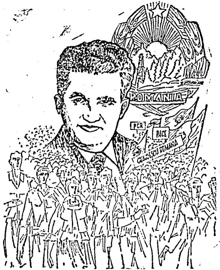
Grafiță de Lucian Cociuba.

Pentru rodnică și îndelungată activitate revoluționară desfășurată spre binele și gloria patriei, omagiem azi conducătorul iubit, omul care și-a închinat întreaga viață, înălțării și fericirii poporului său, adresându-i din plinătatea inimilor noastre viață lungă și sănătate, multă putere de muncă spre măreția neamului românesc, spre binele țării și fericirea patriei, pentru triumful păcii și socialismului în lume!