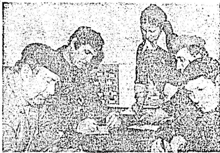
O imagine elocventă la I.A.M.M.B.A.: numeroși oameni ai muncii solicite, în aceste zile, să devină membri în organizația F.U.S.