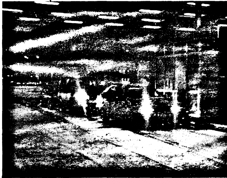
La Nădlac, "imemorialul" arată numărul trei autoturismelor...

● La Nădlac, primii plecați în Europa au fost străinii ● Alarmă falsă ● Cu asigurarea medicală și triunghiurile reflectorizante nu e de joacă ● Trafic normal la Curtici