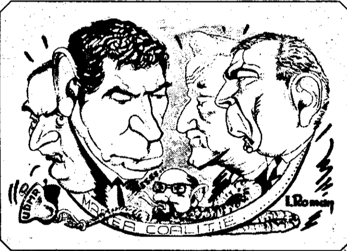
CIVIC - LIBERALII... hotărâți să facă „Marea Coalitție, fără... zurgălăi!