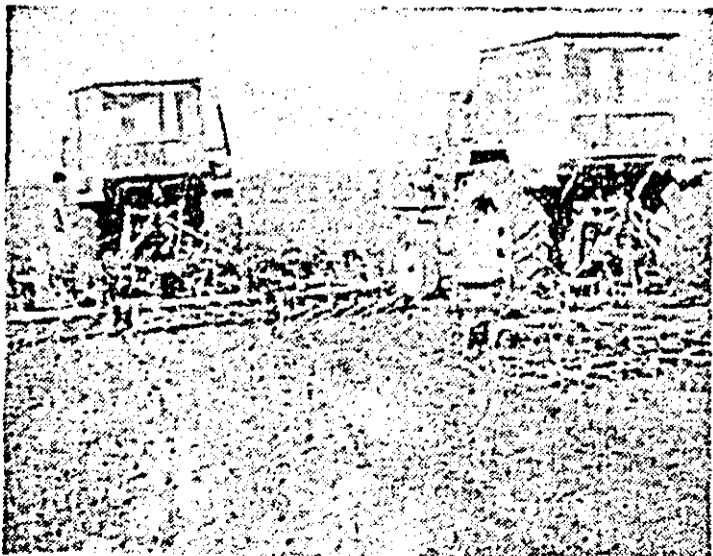
C.A.P. „23 August” Curtici. Pentru urgentarea lucrărilor, întrecut terenul nu e suficient de zvîlnit, pregătirea patului germinativ se face cu combinațoarele, la o adâncime de circa 10 cm.