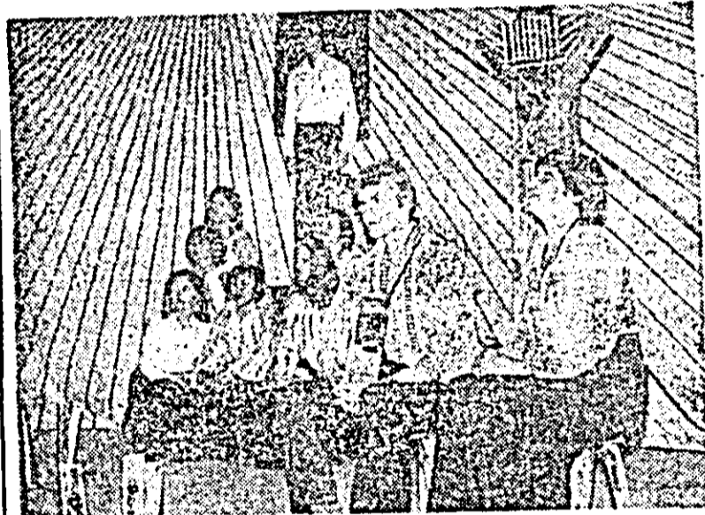
Formația artistică a montajului literar-muzical al tinerilor uteciști de la Combinatul de prelucrare a lemnului Arad, instruită de actorul Iulian Copaceu — prezentă pe scena finalei finale a celei de-a II-a ediții a Festivalului național „Cântarea României” ce a avut loc, recent la Galați.