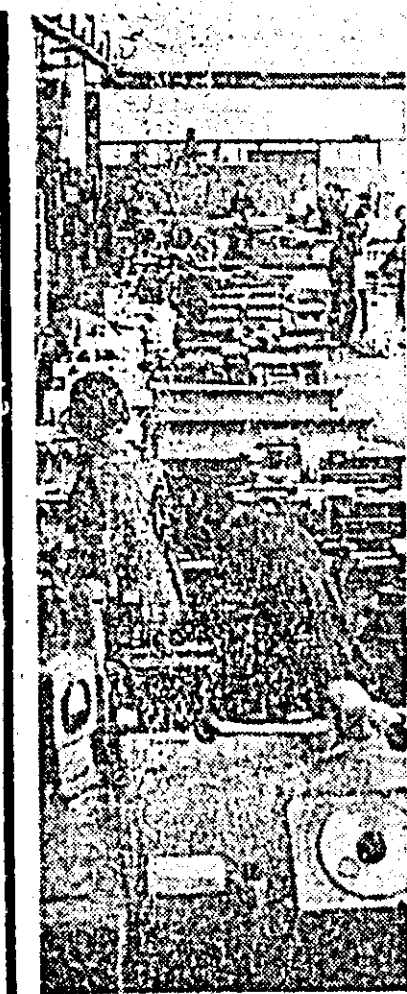
Aspect general în secția de montaj parțial a Uzinei de strunguri.

ÎN NUMĂRUL DE AZI, ZIARUL NOSTRU PUBLICĂ SUB FORMĂ DE PROIECTE