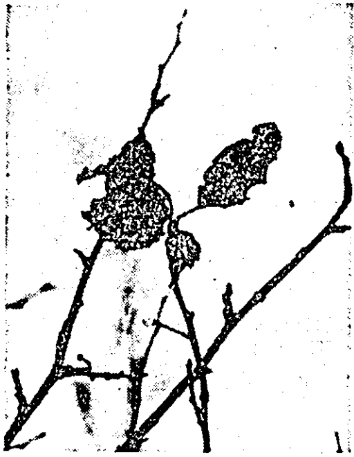
Ultimul mesaj al toamnei...