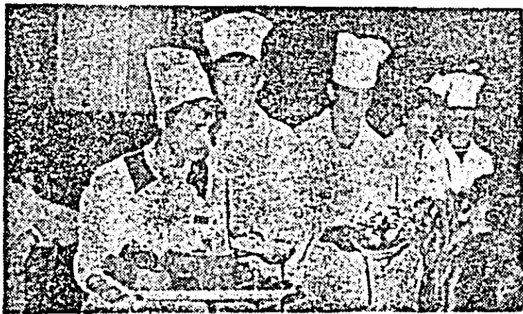
"Parada preparatelor culinare" - tineri bucătari prezintă apetisantele realizări originale.