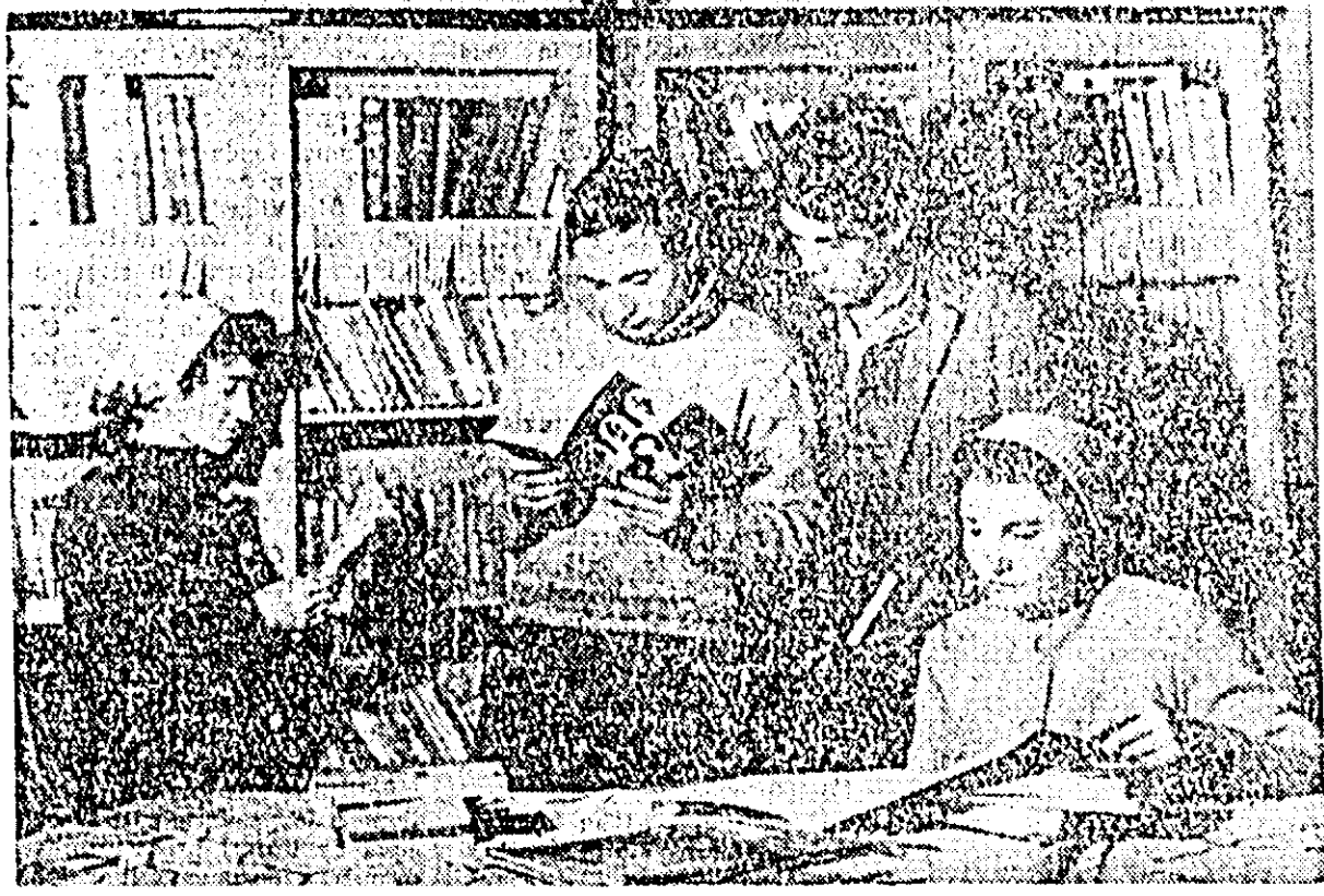
Biblioteca — un loc îndrăgiț de muncitorii Gospodăriei Agricole de Stat Utvinș.