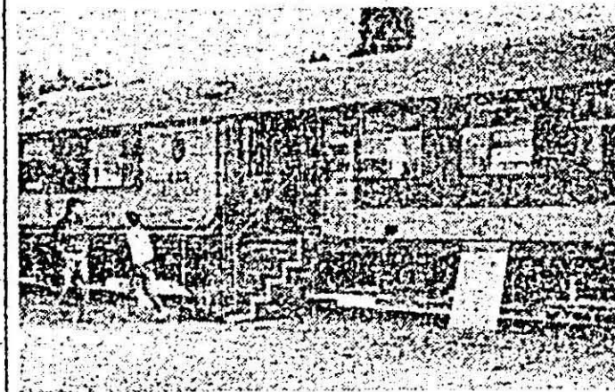
Printre produsele deosebit de apreciate la T.I.B. '88 se numără și vagonul poștal pentru trafic intern și internațional realizat la I.V.A.