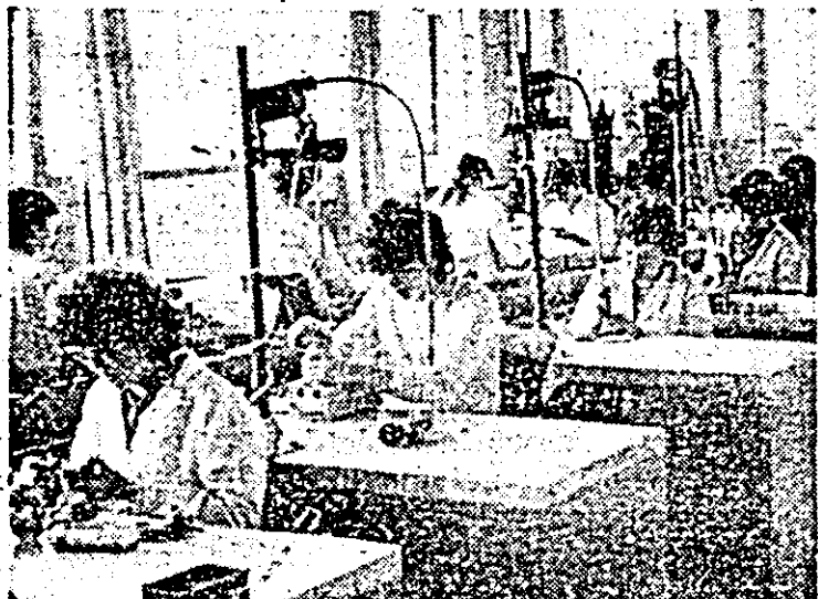
Aspect de muncă în atelierul montaj al Întreprinderii de orologerie.