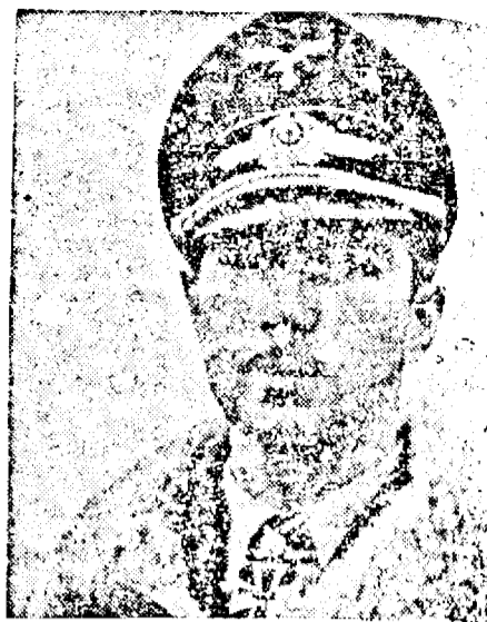
Celebrul colonel aviator Molders, recent într-un accident aviatic.

În această intensitate a fost împins tot ceea ce nu-i plăcea lui Stalin, începând cu Trozki și terminând cu acei partizani comuniști, cari rupându-se de solul natal și venind în Rusia au găsit să propoaze ceva metodele staliniste. Protocoalele consiliului economic superior și ale GPU-ului ne oferă autentice informații despre așteptările care s'au pus în aceste regiuni paradisiace de bogate — poate cele mai bogate din lume — și cum a fost sabotată orice muncă constructivă de popoarele o-