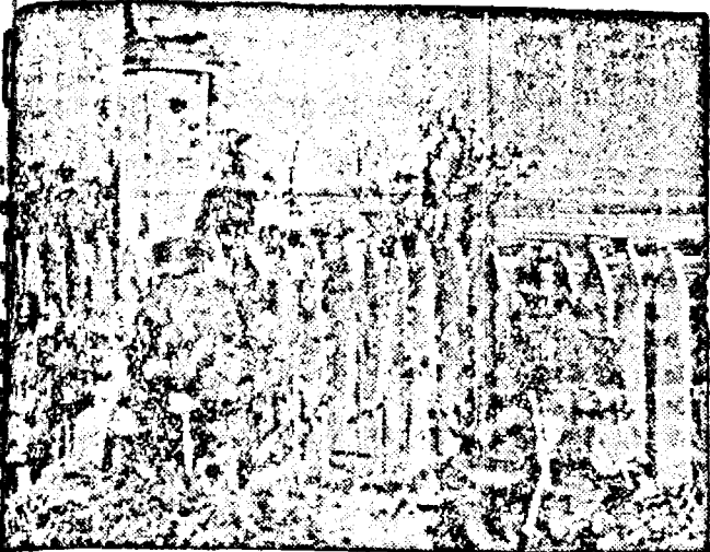
Cercul în jurul Leningradului se strânge necontenit. Infanteriștii germani din formațiunile SS atacă un cuib de rezistență bolșevic de pe frontul dela Leningrad.

Indivizii au așezat apoi sub transformator o încărcătură de dinamită, și închizând clădirea cu cheile, au dispărut. Paznicul a reușit să închidă rezervorul, înlăturând astfel catastrofa. Autoritățile au deschis o anchetă.