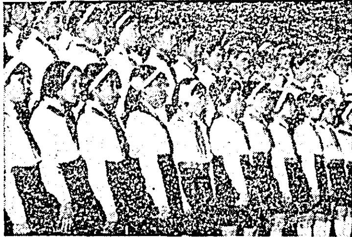
Corul școlii generale din Ineu la faza județeană a Festivalului național „Cântarea României”.

portațe, ilustrații și cu clasamentul acestei remarcabile faze județene a pionierilor și elevilor.