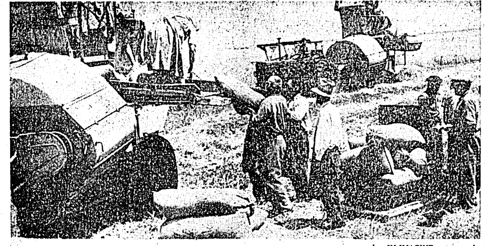
IN IMAGINE: un aspect de la seceriș pe tarlalele cooperative agricole de producție „Podgoria”. Se cîntăreșcă sacii pe care combinele îi aduc pînă la marginea tarlalei.