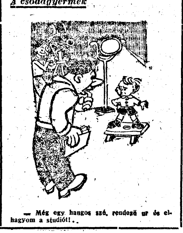
Még egy hangos szó, rendező ur és elhagyom a stúdiót!