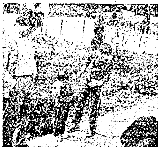
Lectia de fotografiat... realizata de ST. MATYAS

aspida), un șarpe lung de circa 90 cm de culoare maron-roșcată, cu strieții negricioase. În anotimpurile umede și friguroase, viperele hibernează. Reptila năpârste de mai multe ori în decursul creșterii. Ea dă naștere cu regularitate la mici vipere, lungi de 15-20 cm, care vor fi adulte la 4-6 ani. De notat o particularitate: oul de viperă nu vede niciodată lumina zilei, ecloziunea avînd loc chiar în interiorul mamei.