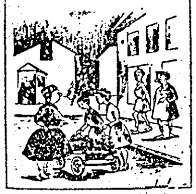
S-a mutat piața pe stradă? Pentru cei cărora le e greu să meargă pînă în piață.

S-a creat un fel de obicei rău ca după orele de plată (Piața Filimon Sirbu), pe strada Fr. Liszt să se înșire cărucioare cu salată, ceapă, spanac etc. Blocîndu-se astfel circulația pe stradă, dîndu-i pe de altă parte, și un aspect urât, din toate acestea în timp ce în imediata apropiere se află piața Meseriev, destinată desfacerii produselor în fiecare după-masă.