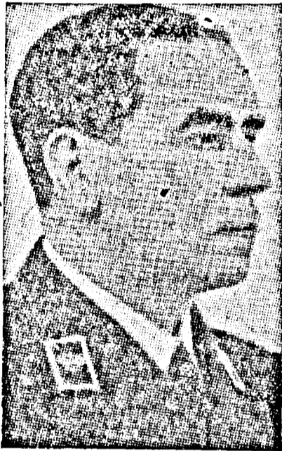
gal Gh. Tătărescu, președintele consiliului. D. Ionescu-Sisești, ministrul

agricultorii, a expus măsurile luate de către organele administrative în vederea executării muncilor agricole. Consiliul luat apoi în dezbateri principiile de bază a legii ce urmează a fi alcătuită pentru împiedecarea cumulului în funcțiunile publice, desemnând o comisie interministerială pentru întocmirea proiectului.