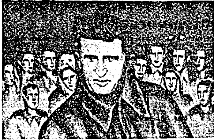
„La miting” — tapiserie de Elena Stoinescu Muntean.

Pentru preocuparea sa perseverentă privind înscrierea agriculturii noastre pe făgașul progresului continuu, țărâna mea cooperatistă, toți oamenii muncii din satele județului Arad, alături de întregul popor, îl poartă tovarășului Nicolae Ceaușescu o profundă dragoste și recunoștință, angajându-se să înfăptuiască exemplar istoricele hotărâri ale Congresului al XII-lea al P.C.R.