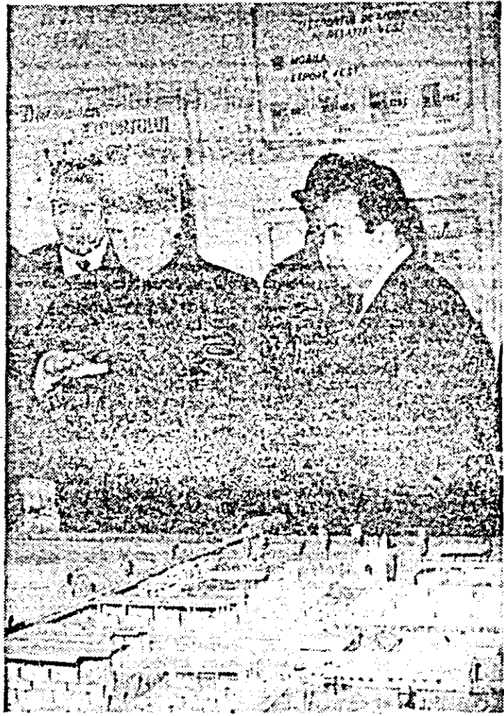
Tovarășul Nicolae Ceaușescu în mijlocul oamenilor muncii de la C.P.L.