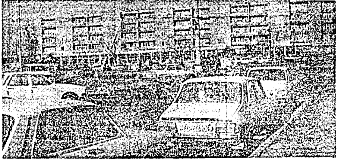
Din noul peisaj urbanistic al Aradului — Piața Gării.