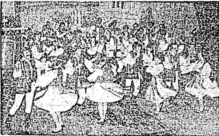
„În vîltele jocului...” Pe scenă, ansamblul de dansuri populare al Casei de Cultură a municipiului Arad.