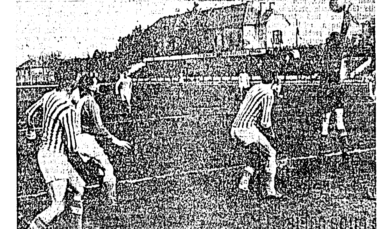
IN CLISEU: o fază de la meciul de fotbal dintre formațiile de categoria regională Teba — Electromotor Timișoara.

Duminică dimineața pe stadionul CFR s-a disputat partida de categoria regională Teba — Electromotor Timișoara.