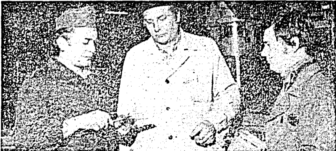
Un grup de muncitori de la I.A.M.M.B.A. studiază posibilitatea realizării de economii de materiale, încă din faza de debitare.