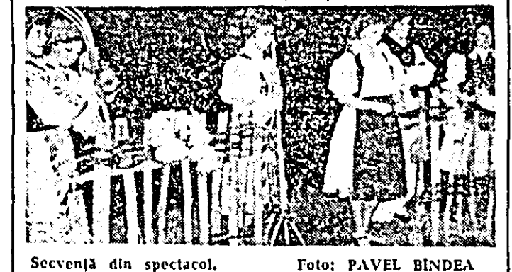
Secvență din spectacol.

poetel de către artiștii amatori sebișeni, spectacolul a cules aplauze pe scenele caselor orașenești de cultură din Sebiș, Arad, Oradea, precum și frumoase aprecieri din partea numerosului public spectator prezent la desfășurarea programului.