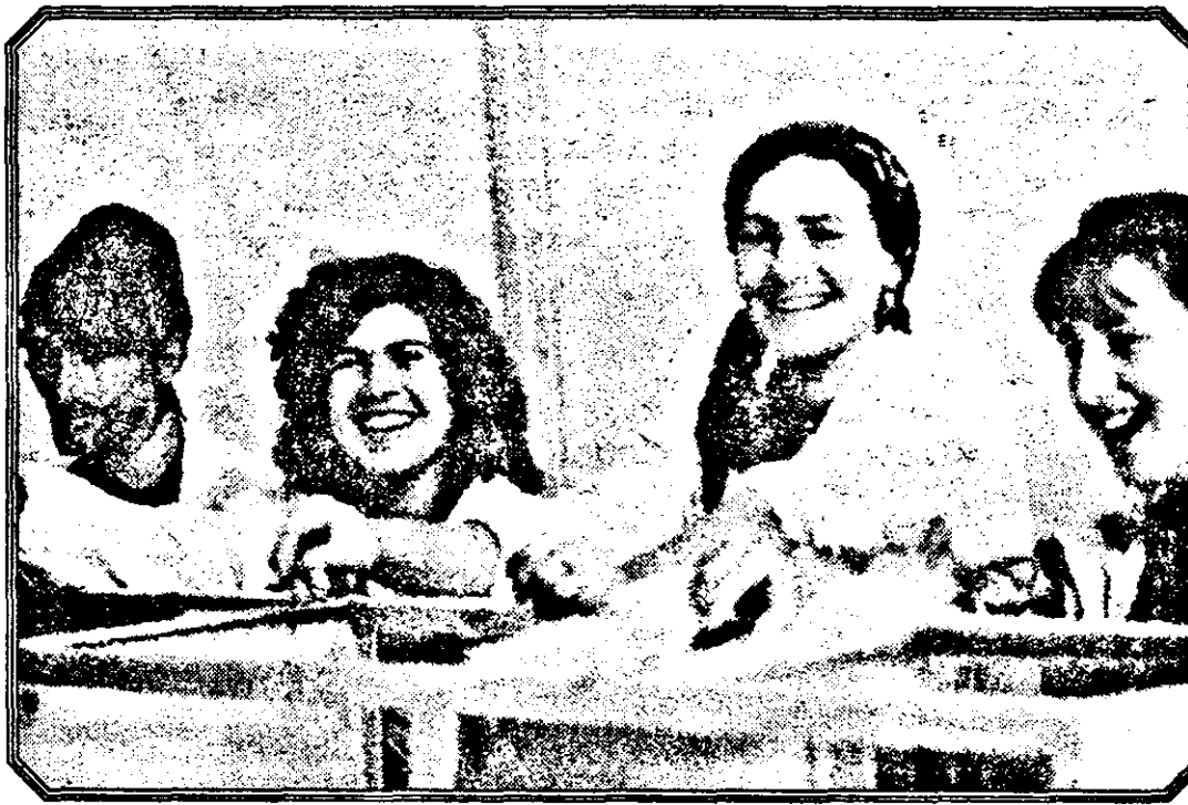
Ciobănaș cu trei... ciobănițe.