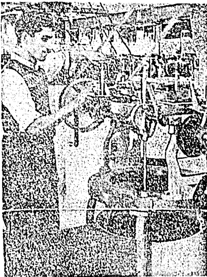
Fabrica „Tricolor roșu”. Secția circulară. Recent au intrat în funcțiune două mașini de tricatat. În scurt timp vor mai fi date producției încă trei mașini. Toate mașinile au fost recondiționate în fabrică.