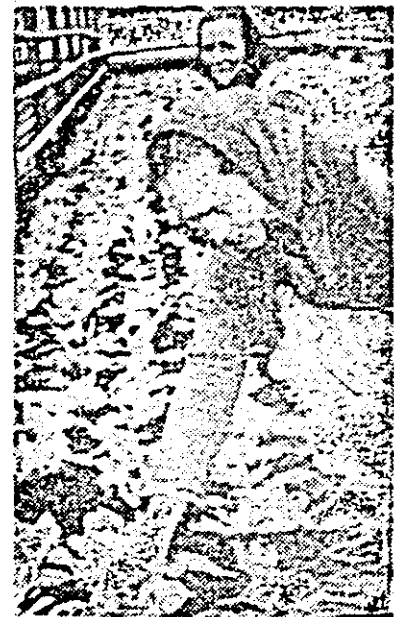
În sera C.A.P. Dorobanți.