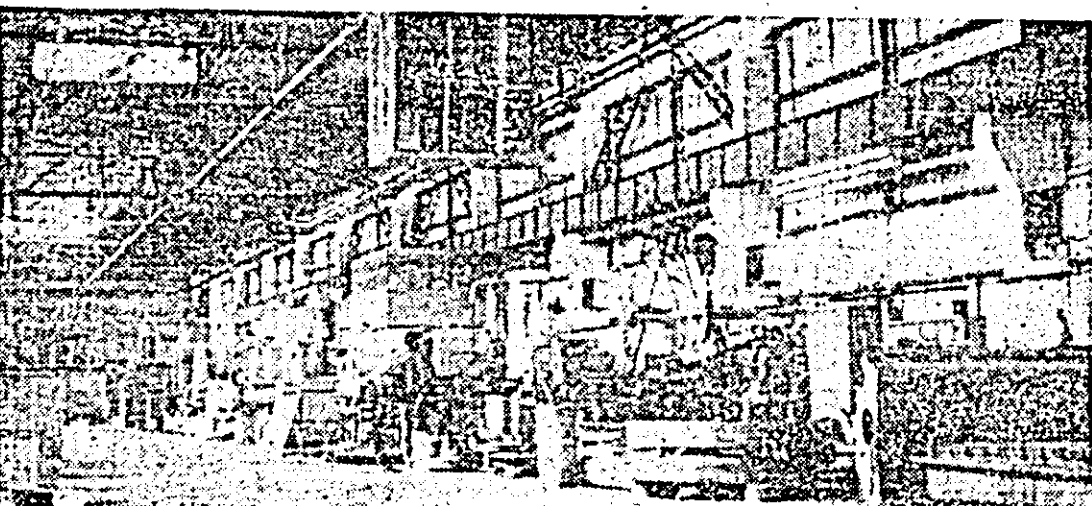
Întreprinderea de mașini-unelte Arad. Vedere generală a halei strung mijlocu.