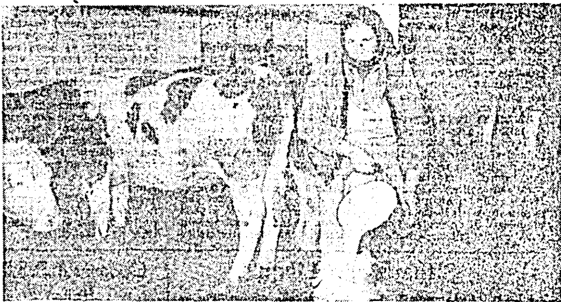
Printre îngrijitorii fruntași din fermă se numără și Valerica Pop care lucrează permanent, de zece ani, la lotul de vaci.

— Deci îngrijitorii de animale deși domiciliază mai aproape sau mai departe de fermă au găsit posibilități ca, în ciuda timpului geros, să fie prezenți la program, ca și dumneata de altfel, pe cînd colaboratorii apropiați își permit să intrize. În paranteză fie spus, nici pînă la ora 7 pînă