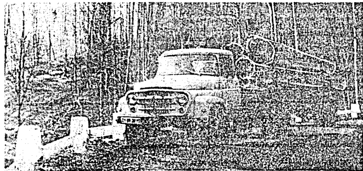
În parchetele de exploatare munca cunoaște un înalt grad de mecanizare. Mașini autotrolii, ca cea din fotografia de mai sus, nu numai că transportă buștenii dar îi și încarcă mecanizat printr-o simplă apăsare pe buton.

va lua calea industrializării, sporindu-și astfel valoarea... — Aceasta depinde de cei care lucrează în parchete, la exploatare, nu? — Numai de noi depinde ce se va alege din lemnul pe care l se doborîm. Sortat, ales cu pricepere, folosit fiecare bucată chiar acolo unde poate fi bun, așa își poate căpăta masa lemnoasă adevărată ei valoare. Avem un plan și în această privință. Atît la sută, buștenii pentru furnir, cherestea sau traverse, altele lobe industriale, sau pentru celuloză etc. Iar restul pentru foc. În toate parchetele în care am lucrat lemnul de lucru pe care l-am scos a fost mai mult ca cel din plan. În parchetul acesta avem un asemenea plan de 56 la sută. După cum merg treburile o să scoatem vreo 70 la sută. Și pentru aceasta oamenii în primul rînd, toți oamenii noștri își au meritul.