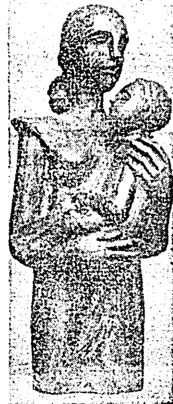
„Maternitate” sculptură de PETRU STOICU

Expoziția se bucură de un frumos succes de public.