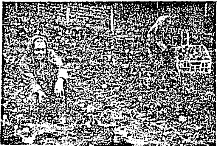
La plantat varză timpurie în cîmp pe terenurile Stațiunii legumicole din Aradul Nou.