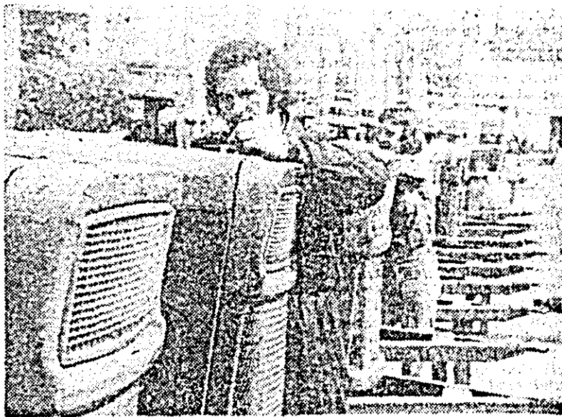
Ultimele verificări la un lot de agregate de pompare fabricate la I.M.A.I.A.