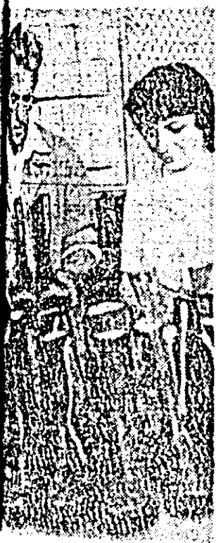
În sezonul de iarnă, întreprinderea „Libertatea” oferă o largă de încălziminte.