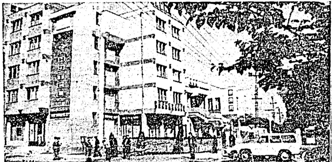
De-a lungul ultimelor aproape două decenii de existență socialistă a orașului, Sebișul a cunoscut o adevărată metamorfoză și în domeniul edificat-gospodăresc, al construcțiilor de locuințe. În imagine: noul complex hotelier din centrul civic al orașului.

Așadar, orice s-ar spune, cuvintele „salt spectaculos” raportate la realitățile orașului Sebiș de astăzi nu sînt deloc gratuite în comparație cu ceea ce era aici cîndva, cu ani în urmă. Fiindcă în devenirea sa socialistă, liberă și demnă, orașul Sebiș și oamenii săi hărnic și bunl gospodari au fost adevărații martori și lăptuitori ai acestui salt impresionant — cu toate implicațiile sale — spre industrializare și dezvoltare, realizat și pe aceste plături românești de