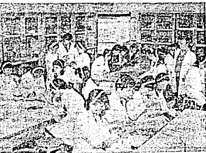
Laboratoare moderne întregesc zestrea dotărilor destinate bunicii pregătiri teoretice și practice a tineretului studios. Iată o imagine din laboratorul de chimie al Liceului Industrial Sebiș.

Pagină realizată de: CONSTANTIN SIMION