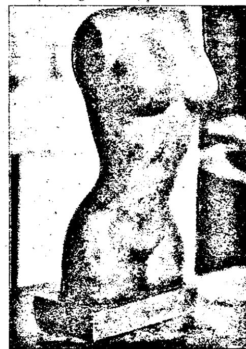
apoi, cosor să facă au încercat.

tor și cărunt, au prins coasa ca pre o repede seceră, vădząc că ambia-i părădnică îi era de tot teaferă. Și, aice e minunea și arătarea, când și coasa ca seceră i s-au rupt, el nice atuncea, în nici un feliu dea hodină, nu au șadzut. S-au aplectat, se dzice și au îngenuchiat, și din seceră-coasă,