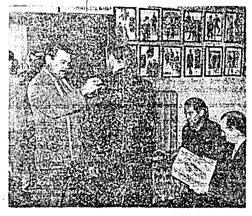
La unitatea de comandă nr. 5 a cooperativei „Artex” în plin sezon de lucru.