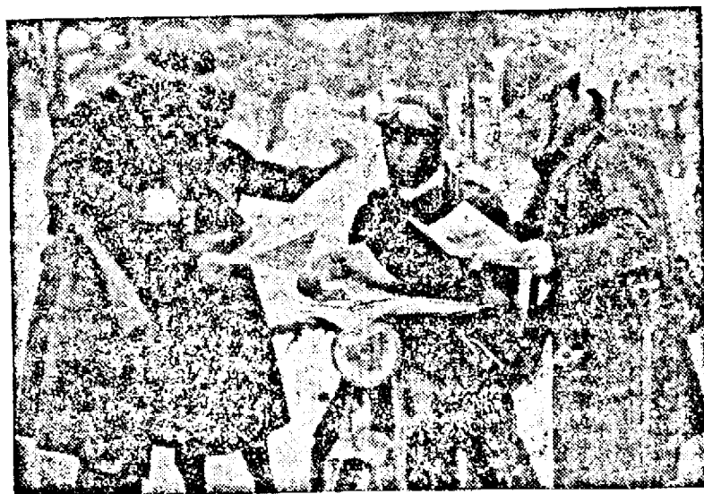
Sosirea jurnalelor pe frontul francez.

Londra, 30 (Rador.) — Activitatea parlamentului în cursul săptămânii aceasta se va concentra în jurul discuției de Joi, în Camera Comunelor, privind problemele economice. Deputații laburiști au depus o moțiune, prin care cer înființarea unui ministru al coordonării economice naționale. Cu ocazia discuției moțiunii dd. Chamberlain și sir John Simon vor pronunța discursuri, subliniind progresele înregistrate în domeniul coordonării economice, dela izbucnirea războiului și până azi.