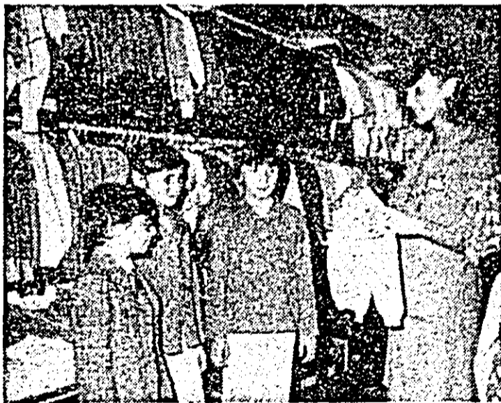
Secvență cotidiană în unitatea nr. 42 „Dojna” a I.C.S. textile—încălțăminte care desfăce un bogal sortiment de tricotațe pentru copii.

• Chiocșul de ziare din Piața U.T.A. stă cam de multă vreme fără lumină electrică. Dimineața, vînzătoarea vind ziare la... luminate. Cum noaptea devine mai lungă, se caută și un... opai!