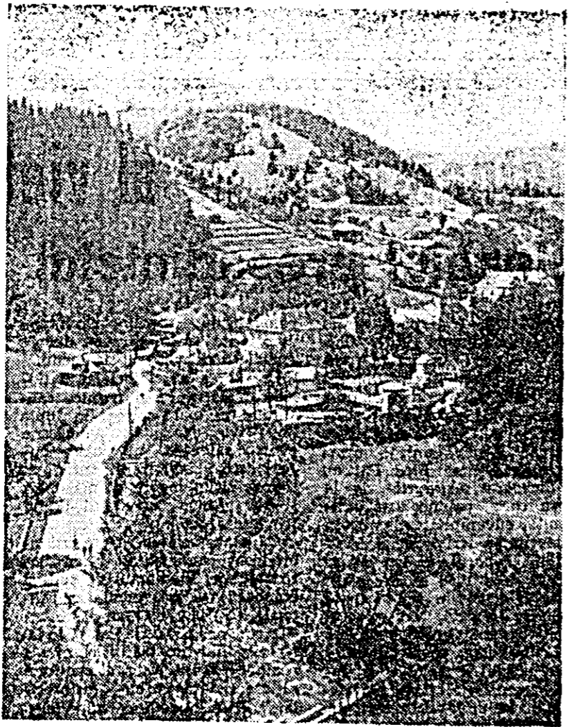
Pe Valea Prahovei.