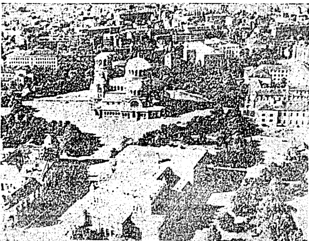
Vedere panoramică a Sofiei.