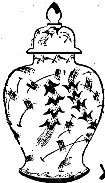
Avalódi Meissen-i porcellán váza, a valódi aranygyűrű.