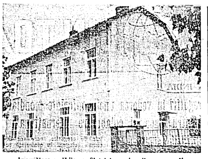
Impunătoarea clădire a Statului popular din comuna Macea, reamenajată recent.