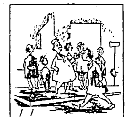
— Dar, cum nu mai aștepti tramvaiul? — Nu! Țin să ajung la timp la serviciu!

Sosirea timpului rece, cu ploaie și vânt, face ca numărul călătorilor cu tramvaiul să sporească. Dar tocmai în această perioadă se resimte o circulație defectuoasă a tramvaielor, mai ales în orele de vîrf.