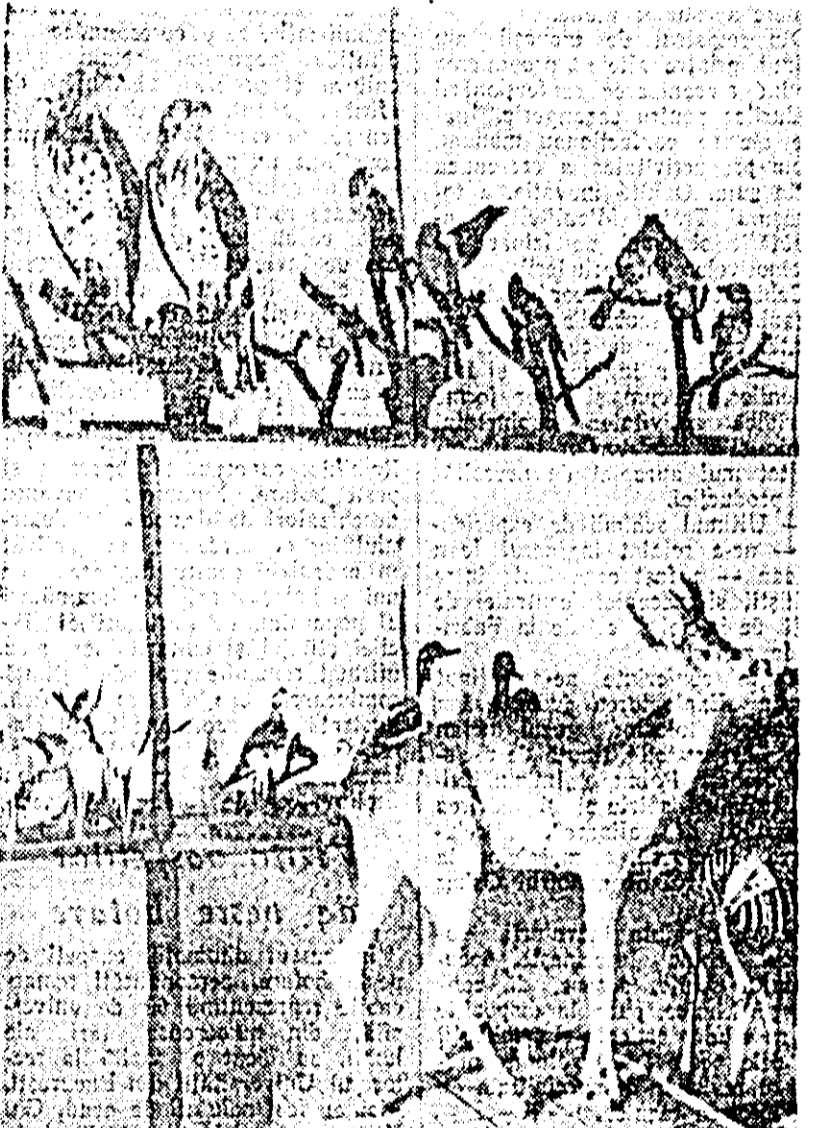
Pe lângă laboratorul de taxidermie de la Arad există o frumoasă sală unde este depozitat vînătul cu pene și păr naturalizat. ÎN CLIȘEU: un aspect din interiorul depozitului.