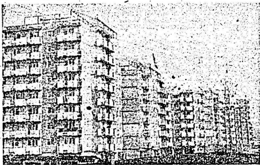
Blocul nou de locuințe în cartierul Micălaça.