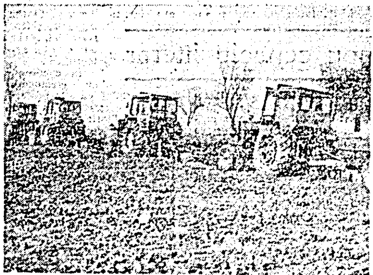
Pe terenurile C.A.P. Socodor, mecanizatorii intensifică executarea arăturilor de toamnă.

Pagina culturală • Insemnări din stațiunea Lipova • Vremea în luna noiembrie • Telegrame externe.