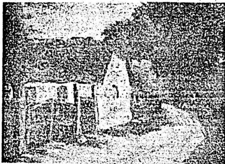
„Stradă din Moneasa”, pictură în ulei din expoziția artistei amatore Iudii Csernyansky, de la atelierul de creație al întreprinderii textile UTA.

* Gala Galaction, „Roxana”, „Papucii lui Mahmud”, „Doctorul Tallun”, ediție îngrijită, tabel cronologic, selecția referințelor critice de Alexandru Ruja — Editura FACLA, 1986.