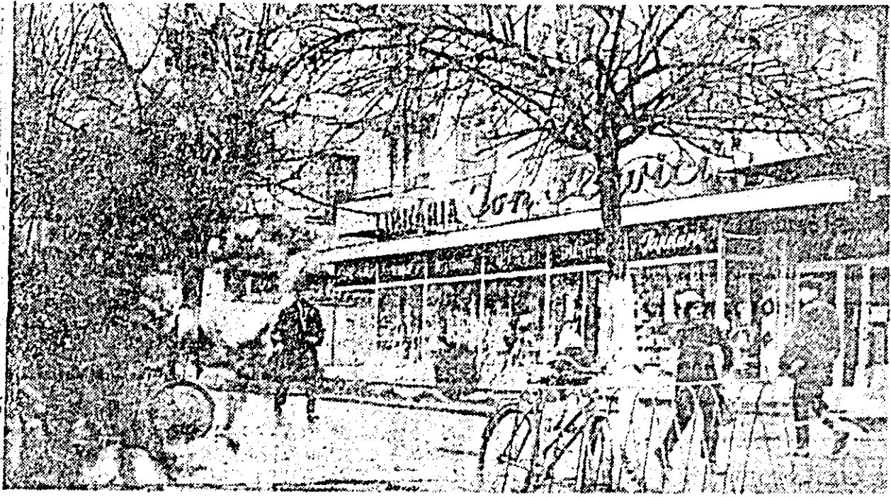
Instantaneu cotidian în orașul Ghiljineu Criș