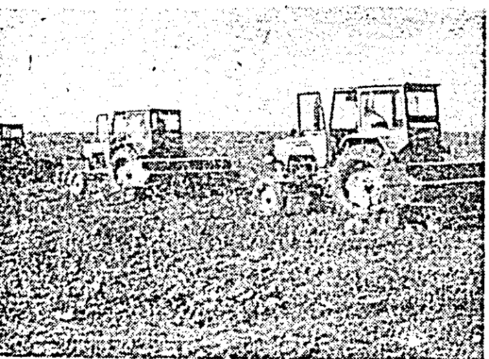
În unitățile din consiliul unic Felnac, se acționează cu forțe sporite la finalizarea semănării grîului.

Lucrarea care trebuie grabnic finalizată în aceste zile este semănatul grîului care pînă în seara zilei de 12 octombrie s-a realizat pe 90 la sută din suprafața cultivată. Este necesar să se urgenceze încheierea însămîntării grîului, îndeosebi în unitățile din consiliile unice Sebiș, Cermel, Ineu, Lipova, Sinleani, Săvlîșin, împingîndu-se lucrărilor un ritm mult sporit, pe întreaga zi-lumină și o calitate superioară lucrărilor.