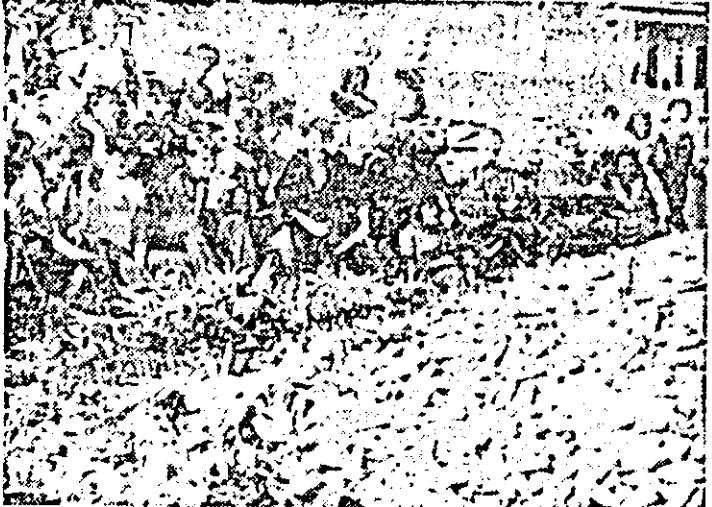
Elevii Școlii generale din Secușigiu aduc o contribuție importantă la depășitul porumbului.