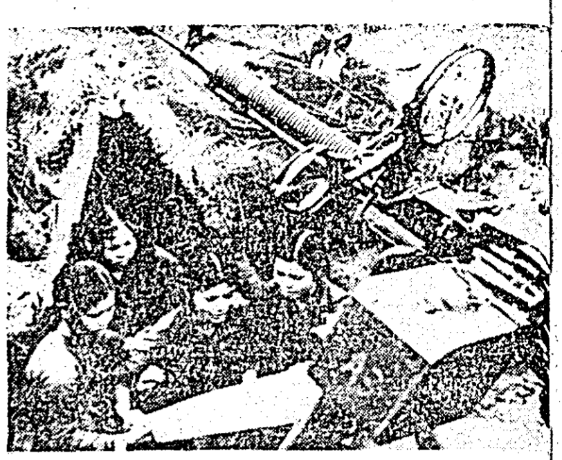
R.D. VIETNAM — Echipă feminină din satul d'Hai Thinh studiind planurile de prevenire a atacurilor aviației americane.

HANOI 22 (Agerpres). — Comitetul Central al Frontului Patriei din Vietnam a organizat la Hanoi un miting de masă cu prilejul celei de-a 14-a aniversări a semnării acordurilor de la Geneva din 1954 cu privire la Vietnam.