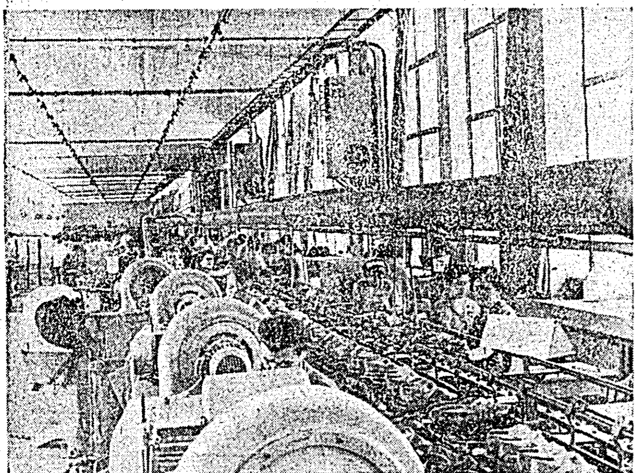
IN CLISEU: Aspect din secția încălzimînto pentru sezonul de vară a fabricii „Liberta-tea” Arad.