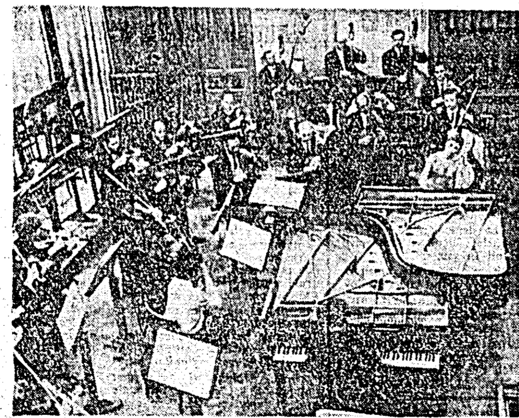
Concert la filarmonică.

„Doină” și un „joc din Ba-nat”, ducînd în fața juriului republican frumusețea cînte-cului de prin aceste locuri. Ne vom bu-cura sincer da-că solista ară-deană de mu-zică populară, reprezentînd regiunea, va întruni apre-cieri care s-o situeze pe unul din locurile fruntașe și, în acest sens, îi dorim mult succes.