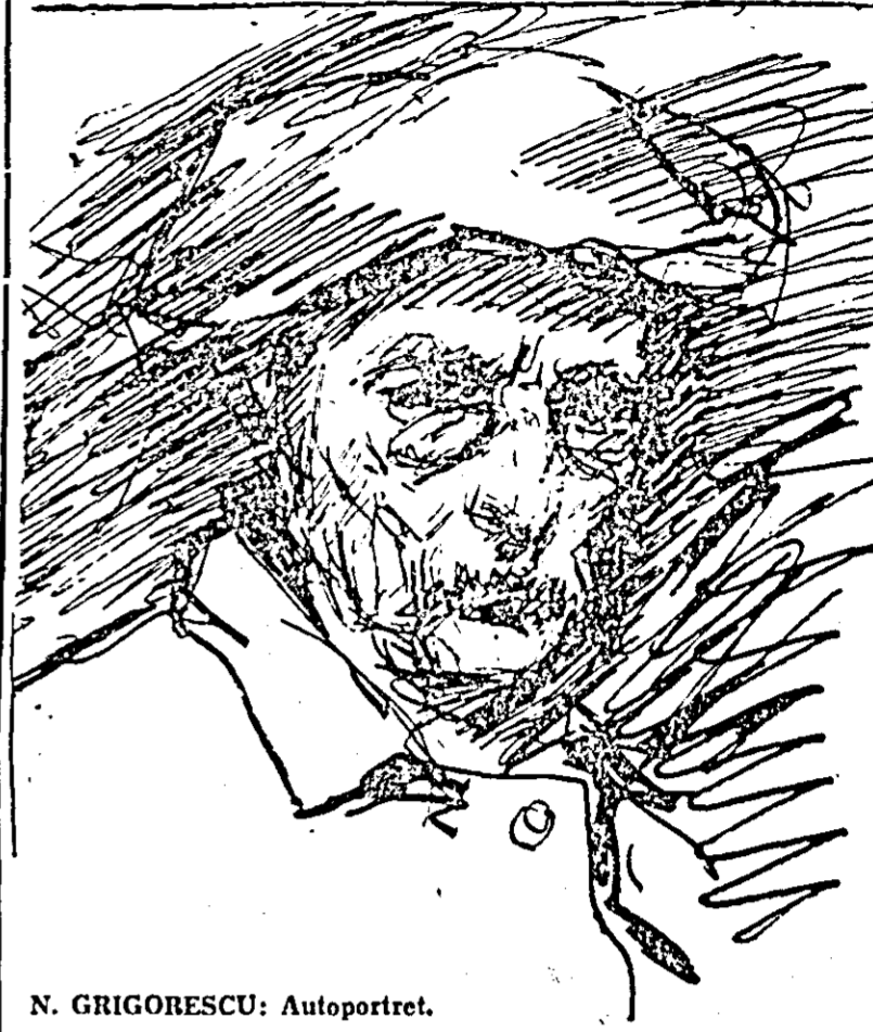
N. GRIGORESCU: Autoportret.

Expoziția de grafică, organi-zată în sala din strada V. A-lecsandri, de către Muzeul re-gional Arad, în colaborare cu Muzeul de artă din Cluj, relevă un aspect mai puțin cunos-cut al creației grigorescienne. Genial minutor al pensulei, Grigorescu a fost totodată un mare desenator. Desenul a constituit pentru el o modali-tate de contact strîns cu reali-tatea și un exercițiu neîntre-rupt. Pentru a ajunge la pu-terea de adevăr și la ușurința de execuție, care ne uimesc în pictura sa, Grigorescu și-a e-zersat netotot observanța și mîna, în nenumărate schițe, realizate în creion, cărbune sau peniță.