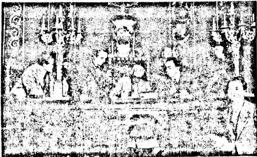
Der erste Regierungsausschuss des neuen Präsidenten von Katalonien Oberst Maria,

Wenn auch nur nach harten Mühen, Doch es muß die Saat erblühen: Einmal, einmal muß auf Erden Jedem Wunsch Erfüllung werden!