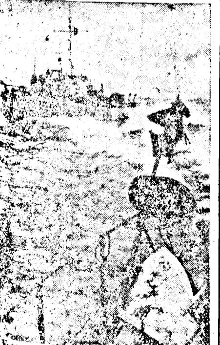
Vase germane de cules mine în Marea Nordului