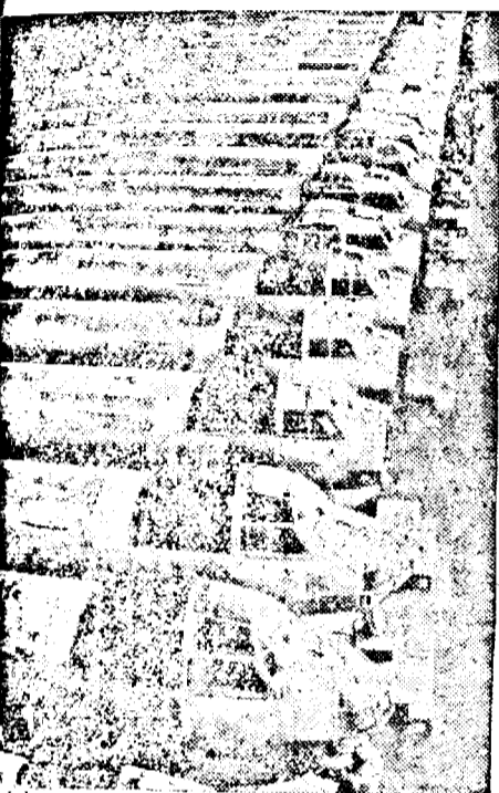
Avioane fabricate în serie într-o uzină din Germania.